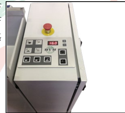
Цифровое программирующ. устройство ПЛК