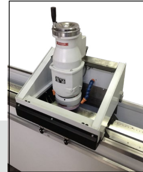
Discesa motorizzata del mandrino