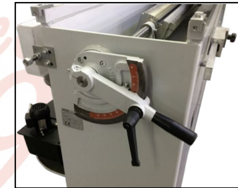
Lev a per rotazione piano 0°-90°