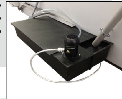
Внешняя ванна с насосом