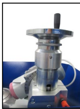
Volantino discesa manuale Manual down-feed handwheel Маховик мануальной подачи/спуска