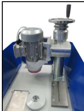
Mandrino con motore 0,37 Kw Motor spindle 0,37 kW Шпиндель с двигателем 0,37 Квт