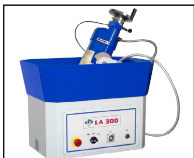
Allestimento standard Standard machine Standardausrüstung