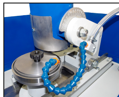
Affilatura controlama Sharpening counter blade Schärfen von Gegenmesser