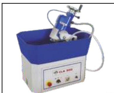
Standard machine 标准机器