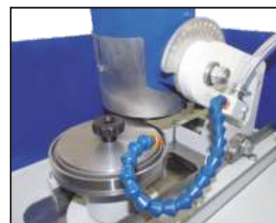
Affilatura controlama Sharpening counter blade 磨削底刀