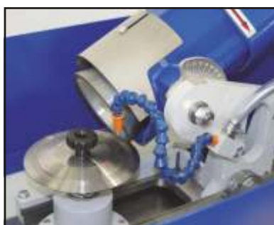
Affilatura lama circolare Sharpening circular blade 磨削圆刀