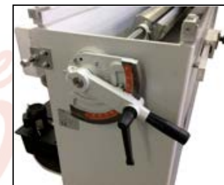
Hebel zum schwenken des Spanntisches 0° - 90°