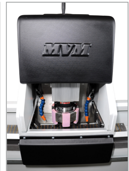
Cambio rapido meccanico della mola