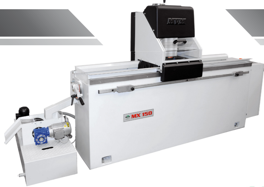
Affilatrice MX con depuratore magnetico a dischi rotanti