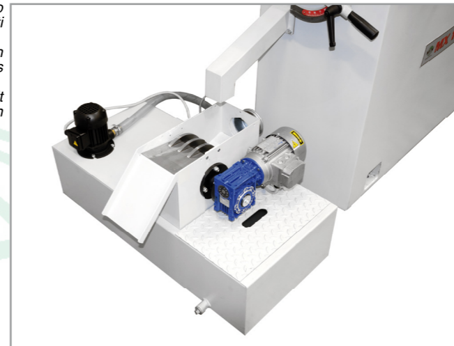
Magnetabscheider mit Drehscheiben