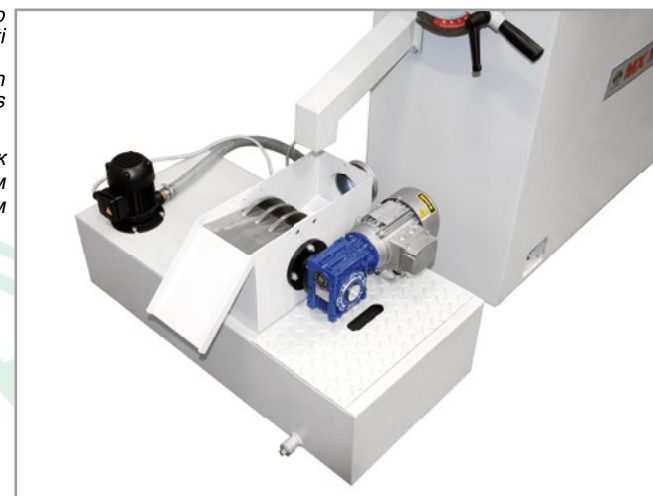
Заточный станок MX с магнитным очистителем