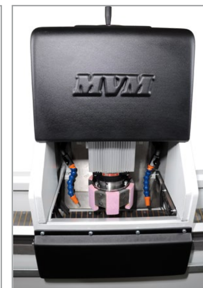
Cambio rapido meccanico della mola