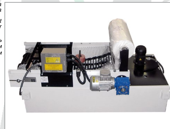
Очиститель с бумажным фильтром