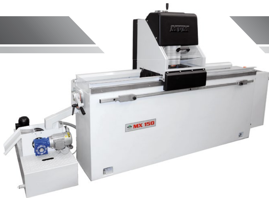
Affilatrice MX con depuratore magnetico a dischi rotanti