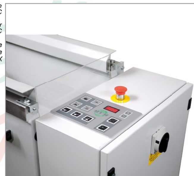
Цифровое программирующее устройство ПЛК