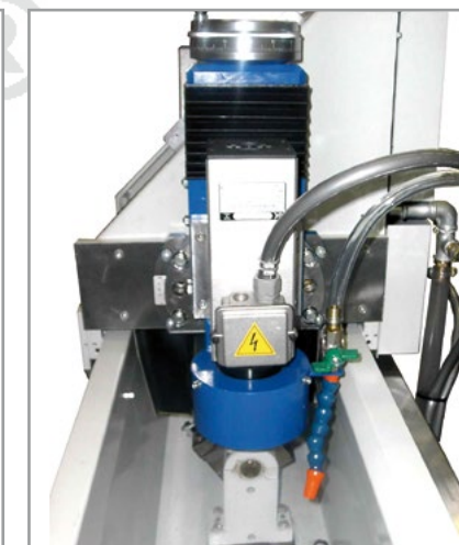
Testa di superfinitura 1,1 kW