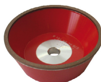
Mola diamantata: Meule diamantée: Muela diamantada: D107 D46 D15