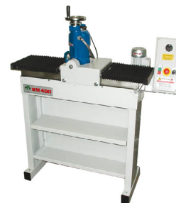
Soffietti di protezione Soufflets de protection Fuelles de protección